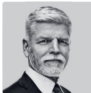
Petr Pavel prezident republiky