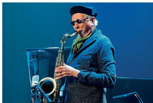
Otevřít se náhodě noci. To je recept, podle něhož vzniká reportáž každého z koncertů Charlese Lloyda.

LN Komunikace mezi vámi broni a osobním zpěvem Williamsovy vzniká dokonale svazkem. Navazujete i na zkušenosti ze spolupráce s kapelami The Doors a Beach Boys v 70. letech? Moje propojení se zpěvkou se totiž začalo tvorit už v dětství v Memphisu, když jsem měl tu čest hrát s bluesmany Howlin'